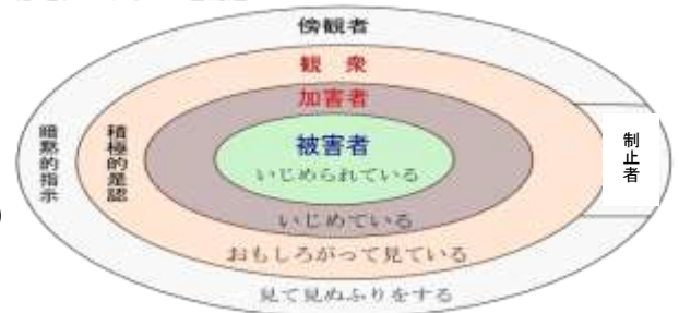
(参考) いじめの四層構造

「観衆」や「傍観者」が「制止者」になることで、いじめの拡大防止、早期発見につながる。